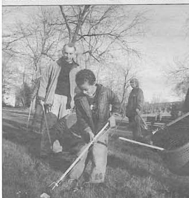
De Buurtschoongroep aan het werk in het Stricklededepark